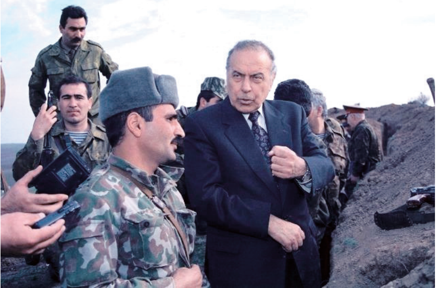
Ulu Öndər Heydər Əliyev əsgərlərin arasında...