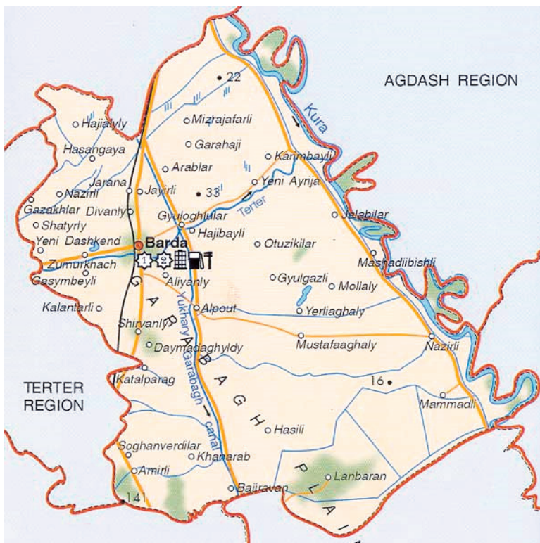
Bərdə rayon inzibati ərazi bölgüsünün xəritəsi