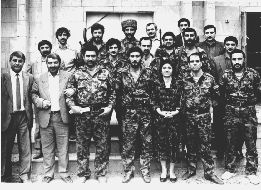
Bərdə Qartalları – Bərdə batalyonu. 1992-ci il

vətənpərvər dəstələr də ermənipərəst qüvvələr tərəfindən müxtəlif damğalarla məhv edildi... Onlar güclərinin yetdiyi qədər Vətənin Bütövlüyünü, Azadlığını, Müstəqilliyini öz qanları, canları bahasına qorumağa çalışdı... bizsə onları qiymətləndirə bilmədik... Sanki yaradan da bizdən üzünü çevirmişdi... Bir tərəfdən düşmən məhv edəndə, bir tərəfdən də biz özümüz özümüzlə qənim kəsilmişdik... Bütün bunlar düşmən hiyləsinin, məkirli niyyətinin, öz düşüncələrinə görə uzaqqörən siyasətinin nəticəsi idi.