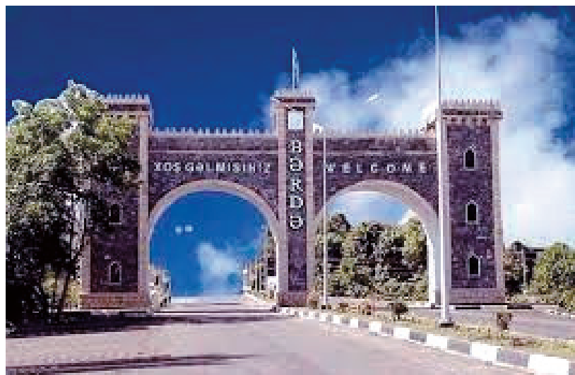
Berdə - Qarabağın giriş qapısı...