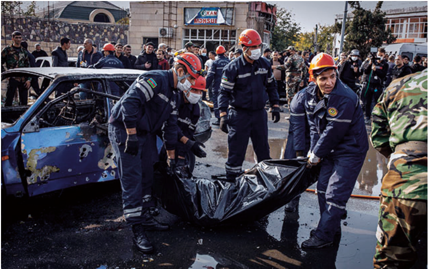
Düşmənin Bərdə terroru